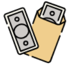
総務・人事・給与・労務