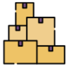
供給・在庫・物流