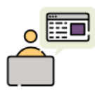
顧客対応販売支援